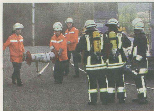
Eile ist geboten: Es werden vier Mitarbeiter der Baufirma vermisst.