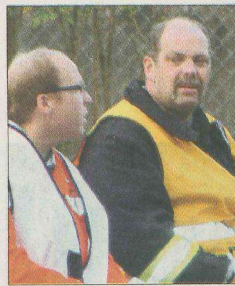
Die kritischen Augen vermerkten Positives wie Negatives.

gen Feuerwehr Rimbach sowie Schlitz-Mitte mit 34 Einsatzkräften und sechs Fahrzeugen.