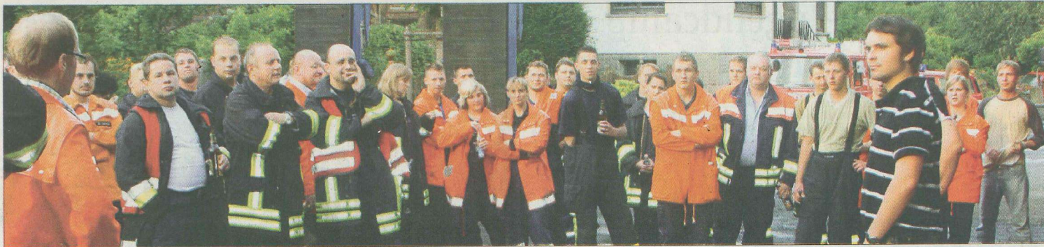
Blick auf die Übungsbesprechung.