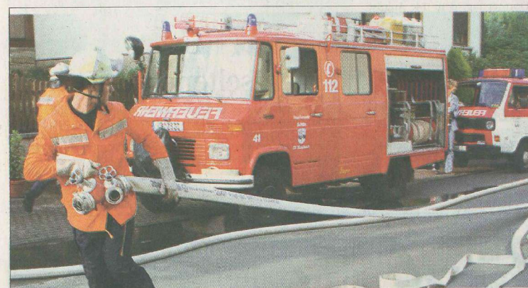
Aufbau einer Wasserversorgung.