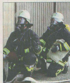
Atemschutzgeräteträger kamen ebenfalls zum Einsatz.